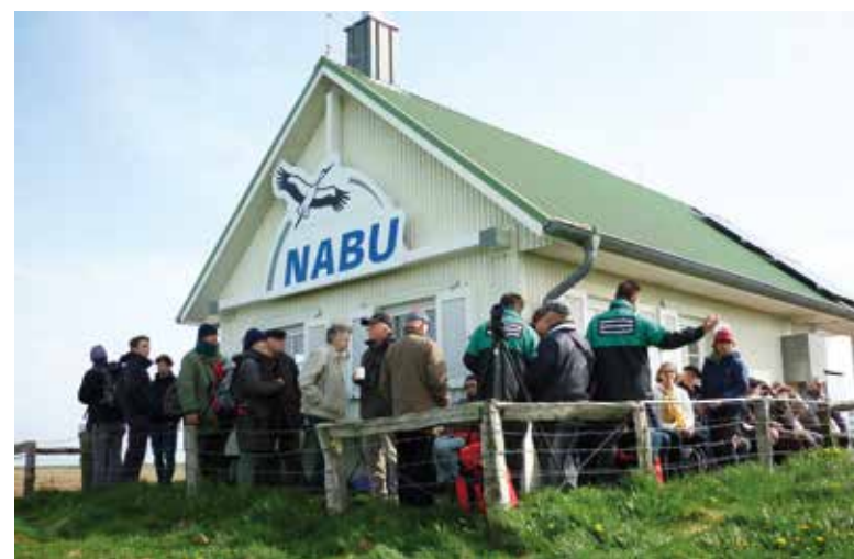
Auf dem Schafberg vermitteln Naturschutzwarte des NABU einen eindrucksvollen Überblick über die umgebenden Salzwiesen

Bitte: Zu Ihrer eigenen Sicherheit und mit Rücksicht auf Brut- und Rastvögel – besuchen Sie die Hamburger Hallig nicht bei drohendem Landunter. Bei Sturmfluten stehen Vorland und Weg unter Wasser!