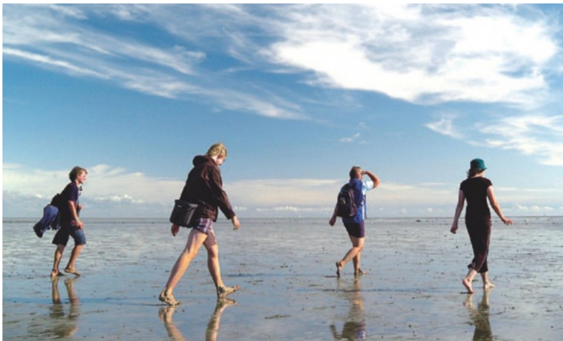
Titelbildausschnitt "Mehrwert Natur"

Die Möglichkeit, Natur hautnah zu erleben, spielt für viele Menschen eine wichtige Rolle bei der Entscheidung für einen Urlaubsort. Das ist das Ergebnis von bundesweiten Erhebungen und Gästebefragungen an der schleswig-holsteinischen Nordseeküste. Informationen zum Zusammenspiel von Natur und Tourismus in kompakter Form bietet die Broschüre „Mehrwert Natur“, die die Nationalparkverwaltung in Kooperation mit der Nordsee-Tourismus-Service GmbH (NTS) herausgegeben hat und die jetzt druckfrisch vorliegt. Sie lehnt sich an die Mehrwert-plus-Broschüre der NTS an: „Wir haben diesen Ball aufgegriffen und das Thema mit dem besonderen Fokus ‚Natur‘ weiterentwickelt“, erläutert die Initiatorin Dr. Christiane Gätje, bei der Tönninger Nationalparkverwaltung verantwortlich für die Bereiche nachhaltiger Tourismus und sozio-ökonomisches Monitoring.