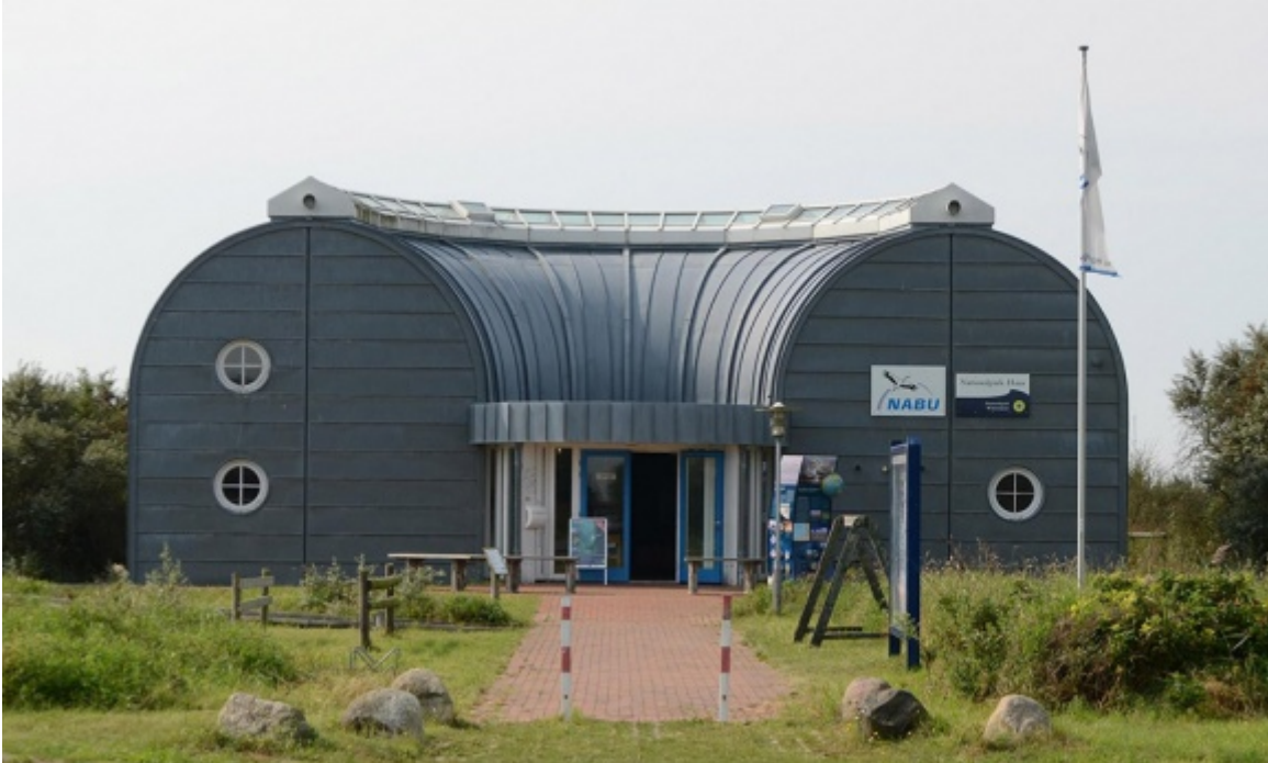
Nationalpark-Station Wattwurm

Zwischen zwei Naturschutzgebieten und Meldorfer Hafen liegt die NABU Nationalpark-Station Wattwurm. Als Bindeglied zwischen dem Speicherkoog und dem Dithmarscher Wattenmeer bietet es eine schön gestaltete Ausstellung zu beiden Themen.