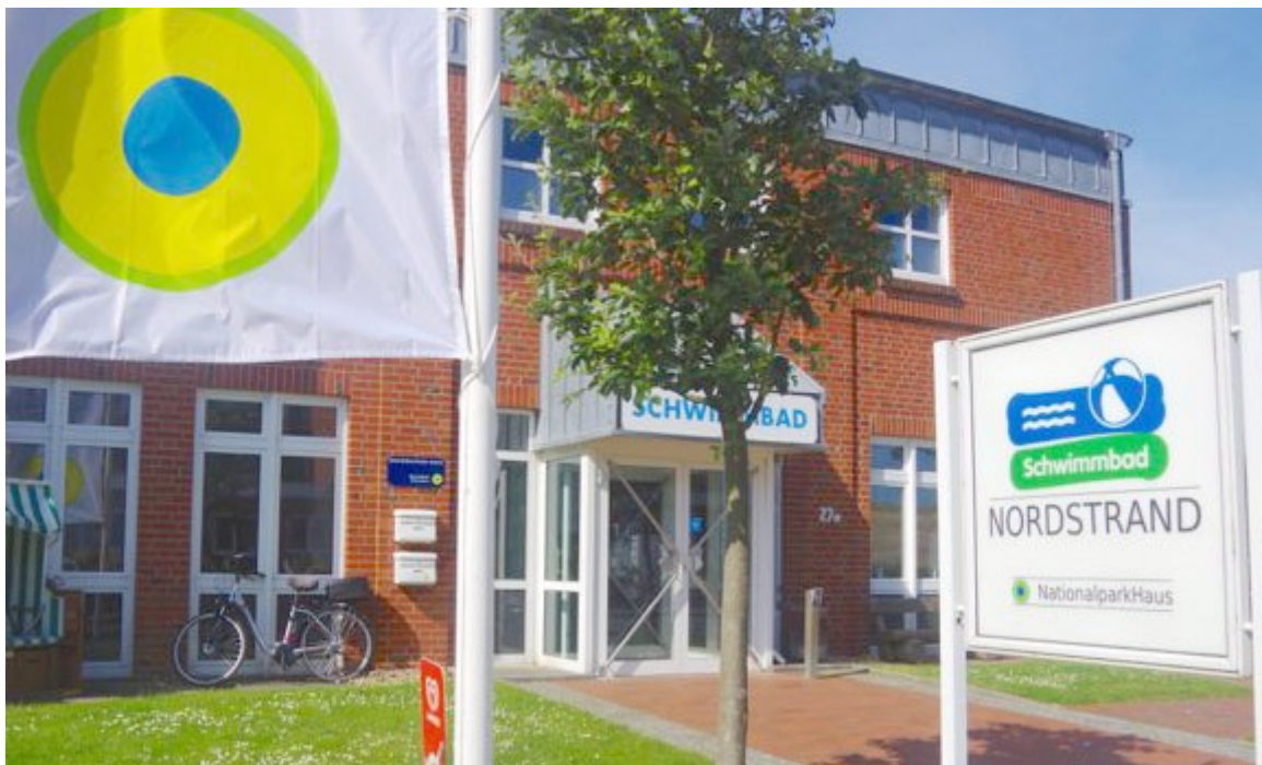
Nationalpark-Haus Nordstrand

Auf einer Ausstellungsfläche von 90 m 2 werden die Themenbereiche Nationalparke weltweit, Ökologie des Wattenmeeres, Landschafts- und Kulturentwicklung der Marscheninseln Nordstrand, Pellworm sowie der Hallig Südfall und der Küstenschutz dargestellt.