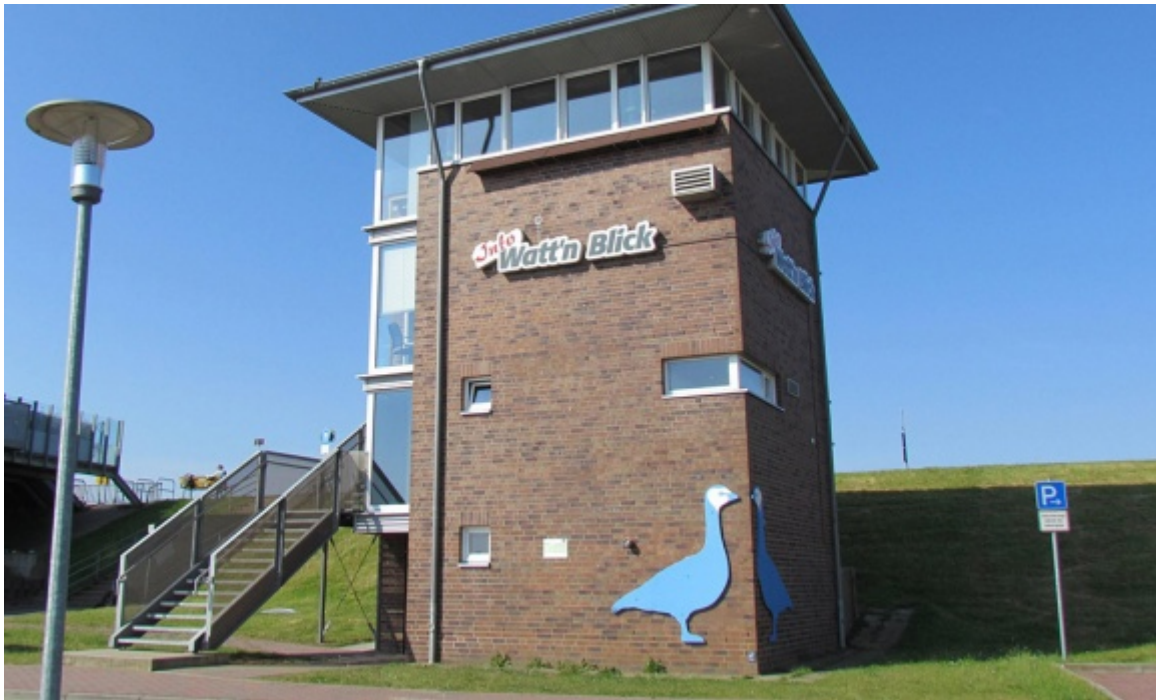
Nationalpark-Station Schlüttsiel

Das Infozentrum Schlüttsiel des Verein Jordsand liegt am Naturschutzkoog Hauke-Haien-Koog.