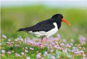
Austernfischer können das ganze Jahr im Wattenmeer beobachtet werden. Sie brüten auch überall auf der Hamburger Hallig. Am schwarz-weißen Gefieder und dem roten Schnabel sind sie leicht zu erkennen.