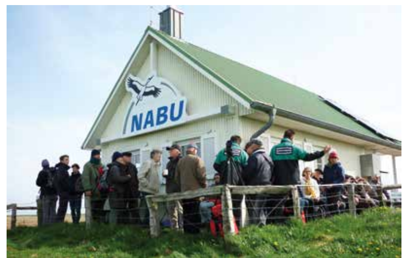
Auf dem Schafberg vermitteln Naturschutzwarte des NABU einen eindrucksvollen Überblick über die umgebenden Salzwiesen

Bitte: Zu Ihrer eigenen Sicherheit und mit Rücksicht auf Brut- und Rastvögel – besuchen Sie die Hamburger Hallig nicht bei drohendem Landunter. Bei Sturmfluten stehen Vorland und Weg unter Wasser!