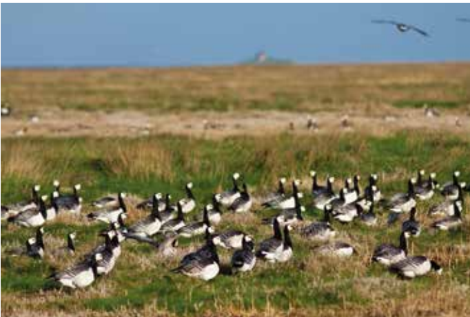
Während der Zugzeit im Frühjahr und Herbst halten sich bis zu 30.000 Nonnengänse im Bereich der Hamburger Hallig auf. Sie fressen sich hier Fettreserven für den Weiterflug in ihre arktischen Brutgebiete an.

Die Hamburger Hallig ist ein wichtiges Brut- und Rastgebiet für viele Vogelarten des Wattenmeeres. Um Störungen der Vögel zu vermeiden, dürfen große Teile der Salzwiesen nicht betreten werden.