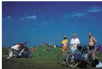
An schönen Sommertagen genießt man das Badeleben auf der Hamburger Hallig

Etwa 60 mal im Jahr wird auf der Hallig Landunter gemeldet, bei Springtide und Sturm auch im Sommer. Während hoher Wasserstände bei starken Westwinden sind die Warften und der Fahrweg ein wichtiger Rastplatz für Vögel. Neben der notwendigen Sperrzeit der Zufahrt aus Sicherheitsgründen im Winterhalbjahr sind deshalb kurzzeitige Sperrungen im Sommerhalbjahr nötig.