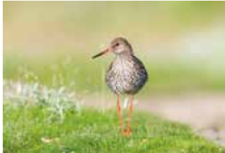
Rotschenkel brüten in Salzwiesen mit höherer Vegetation. Im Frühjahr klingen ihre melodischen Rufe über die Hallig. Sie ernähren sich von Würmern, Krebsen und anderen Kleintieren.