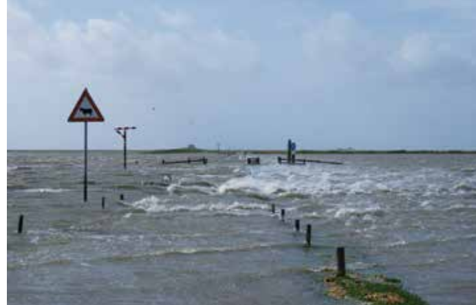
Bei Landunter ist der Weg zur Hallig überflutet und gesperrt

Erosion verkleinerte, lagerten sich im Strömungsschatten an der Ostseite und an der damaligen Festlandsküste Sinkstoffe ab. Durch Handarbeit wurde dieser Zuwachs gesichert. Neues Vorland entstand. 1875 wurde die erste Festlandsverbindung zur Unterstützung der Vorlandbildung hergestellt.