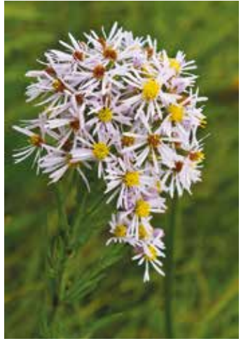
Die Strandaster ist besonders beweidungsempfindlich. Von ihr leben über 20 Tierarten. Sie blüht von Juni bis Oktober und kann bis 120 cm hoch werden.

Salzwiesen sind im ganzen Nationalpark geschützt. Sie bilden das Vorland und bremsen bei Sturmflut die Energie der Wellen. Bitte pflücken Sie keine Salzwiesenpflanzen!