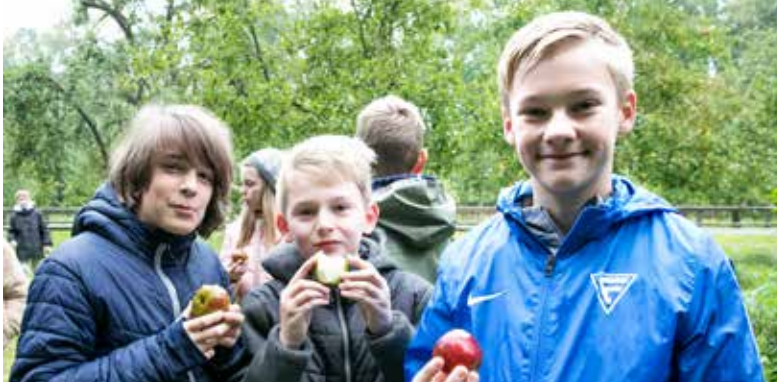
Biosphärenschulen: Praxisunterricht auf der Streuobstwiese