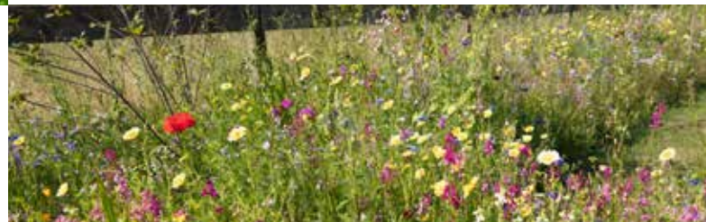
Blühstreifen und Naturgärten mit heimischen Pflanzen fördern die Artenvielfalt.

Gemeinsam die Zukunft der Region gestalten: Sie sind herzlich eingeladen, sich mit für die nachhaltige Entwicklung des Lebensraums an der niedersächsischen Nordseeküste einzusetzen und Ihre Ideen und Projekte einzubringen!