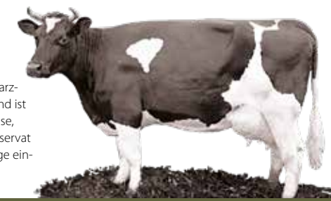
Das Deutsche Schwarzbunte Niederungsgrind ist eine alte Haustierrasse, die im Biosphärenreservat zur Landschaftspflege eingesetzt wird.

Mit einem Arbeitsprogramm, das Projektvorhaben und Ideen zur nachhaltigen Entwicklung beinhaltet, setzt jede teilnehmende Gemeinde dabei ihre eigenen Schwerpunkte. Diese können z.B. im Aufbau regionaler Wertschöpfungsketten für Produktion und Vertrieb regionaler Produkte, sozial- und umweltverträglichen Tourismus oder in der Förderung einer nachhaltigen Mobilität liegen. Kommunen erhalten so die Möglichkeit, angesichts der Herausforderungen von Klimawandel, Energiewende, Rückgang der Artenvielfalt und demographischem Wandel Veränderungsprozesse in der Region gemeinsam nachhaltig zu gestalten.