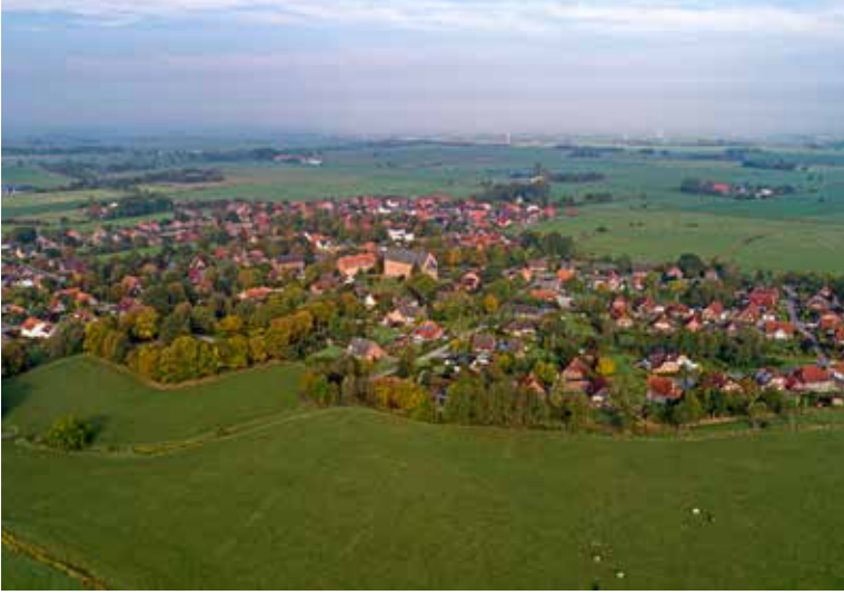
Die Entwicklungszone des Biosphärenreservats – eine historisch gewachsene Kulturlandschaft am UNESCO-Weltnaturerbe Wattenmeer