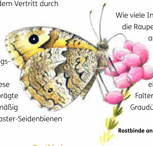
Rostbinde an Glockenheide

Wie viele Insekten der Grau- und Braundünen ist auch die Raupe der Rostbinde auf offenen Rohboden angewiesen. Nachdem die Schmetterlingsraupen sich an verschiedenen Grasarten einen Energiovorrat angefressen haben, graben sie sich in den lockeren Sand zur Verpuppung ein. Die Unterseiten der Flügel der erwachsenen Falter sind farblich kaum von den Oberflächen der Graudünengrasfluren zu unterscheiden.