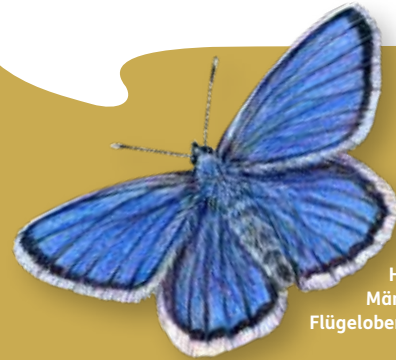
Hauhechel-Bläuling. Männchen sind auf der Flügeloberseite strahlenblau.

Entdeckungsreisen in die Welt der Insekten sind im Nationalpark Wattenmeer einfach und erfordern vor allem die Bereitschaft, das Augenmerk auf die kleinen Dimensionen der Natur zu richten. Dabei gelten die Verhaltensgrundsätze des Nationalparks: Das Einfangen oder Stören der Tiere ist grundsätzlich untersagt. Verlassen Sie markierte Wege nicht. Zahlreiche Arten lassen sich direkt vom Wegesrand beobachten, wenn man sich die Zeit dafür nimmt.