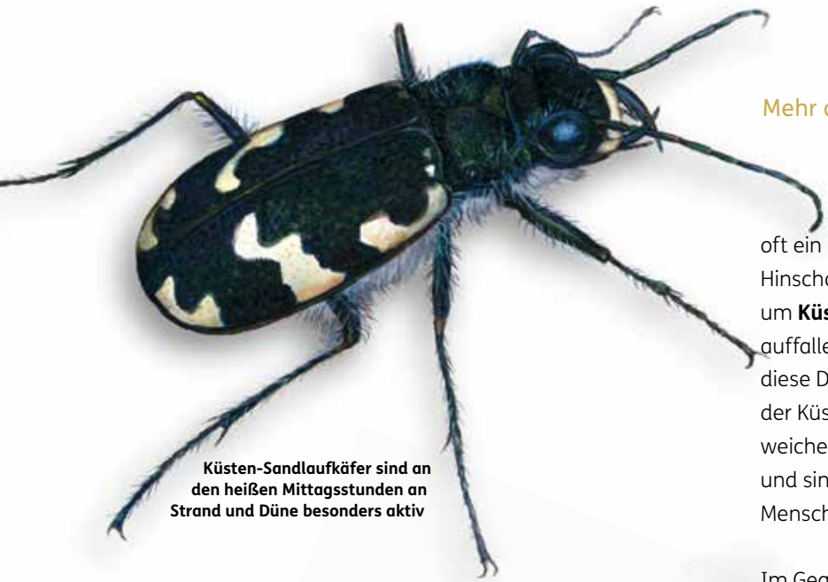
Küsten-Sandlaufkäfer sind an den heißen Mittagsstunden an Strand und Düne besonders aktiv

Eine kleine Auswahl typischer oder besonderer Bewohner von Stränden, Dünen und Salzwiesen