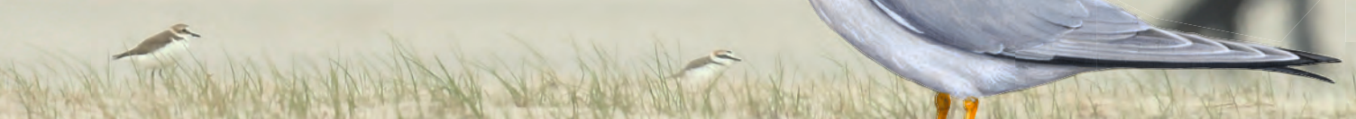
Seeregenpfeifer am Borkumer Nordstrand

Dieses Miteinander kann nur funktionieren, wenn sich alle an bestimmte Regeln halten.