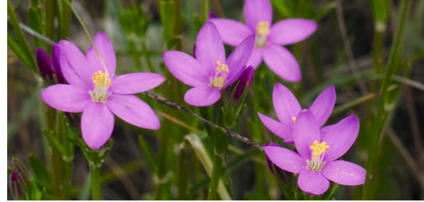
Zwergseeschwalbe Fotos rechts: Tausendgüldenkrout, Sandregenpfeifer, Nordstrand, Seehund, Surfer vor Seehundsbank