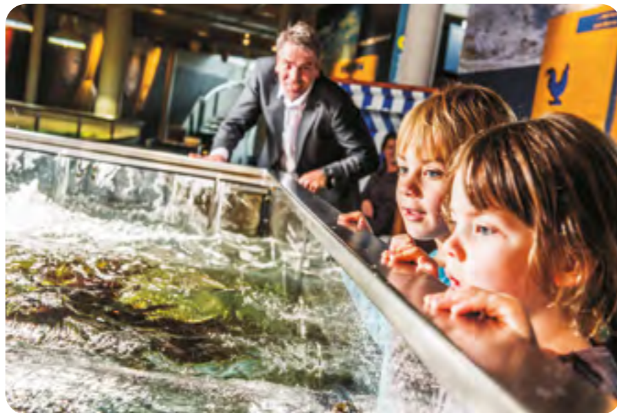
Das Multimar Wattforum ist das größte Informationszentrum im Nationalpark Schleswig-Holsteinisches Wattenmeer.