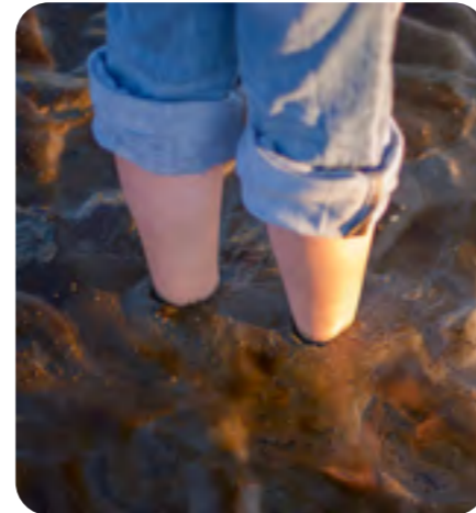
Draußen im Watt lässt sich der Nationalpark mit allen Sinnen erfahren.