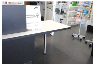
Kasse, Rezeption und Shop