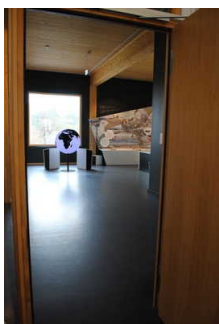
Weg in der Ausstellung / Rundgang, verbindender Weg zwischen den Ausstellungsräumen, WC, Shop