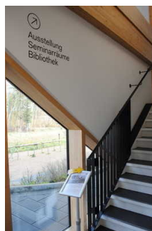
Wegezeichen in der Ausstellung / Rundgang, verbindender Weg zwischen den Ausstellungsräumen, WC, Shop