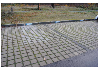
Parkplatz für Menschen mit Behinderung