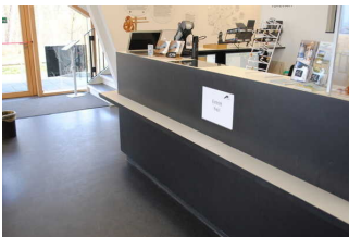
Kasse, Rezeption und Shop