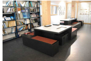
Ausstellung 2.OG Bibliothek