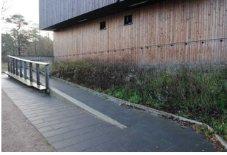
Rampe auf dem Weg vom Parkplatz und ÖPNV zum Eingang