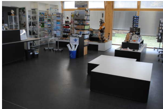
Shopbereich im Foyer