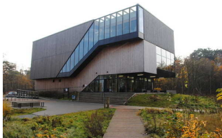
UNESCO- Weltnaturerbe Wattenmeer - Besucherzentrum Cuxhaven