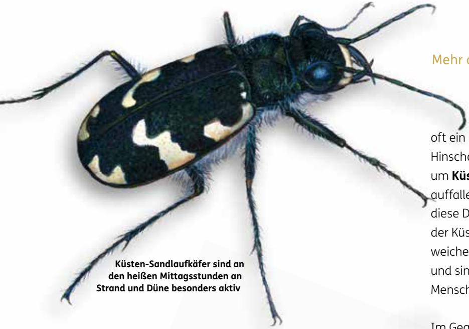
Küsten-Sandlaufkäfer sind an den heißen Mittagsstunden an Strand und Düne besonders aktiv

Eine kleine Auswahl typischer oder besonderer Bewohner von Stränden, Dünen und Salzwiesen