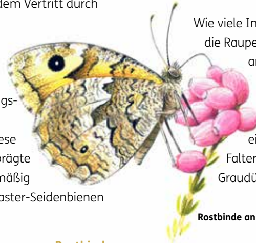
Rostbinde an Glockenheide

Wie viele Insekten der Grau- und Braundünen ist auch die Raupe der Rostbinde auf offenen Rohboden angewiesen. Nachdem die Schmetterlingsraupen sich an verschiedenen Grasarten einen Energiovorrat angefressen haben, graben sie sich in den lockeren Sand zur Verpuppung ein. Die Unterseiten der Flügel der erwachsenen Falter sind farblich kaum von den Oberflächen der Graudünengrasfluren zu unterscheiden.