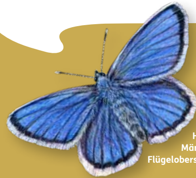
Hauhechel-Bläuling. Männchen sind auf der Flügeloberseite strahlend blau

Entdeckungsreisen in die Welt der Insekten sind im Nationalpark Wattenmeer einfach und erfordern vor allem die Bereitschaft, das Augenmerk auf die kleinen Dimensionen der Natur zu richten. Dabei gelten die Verhaltensgrundsätze des Nationalparks: Das Einfangen oder Stören der Tiere ist grundsätzlich untersagt. Verlassen Sie markierte Wege nicht. Zahlreiche Arten lassen sich direkt vom Wegesrand beobachten, wenn man sich die Zeit dafür nimmt.