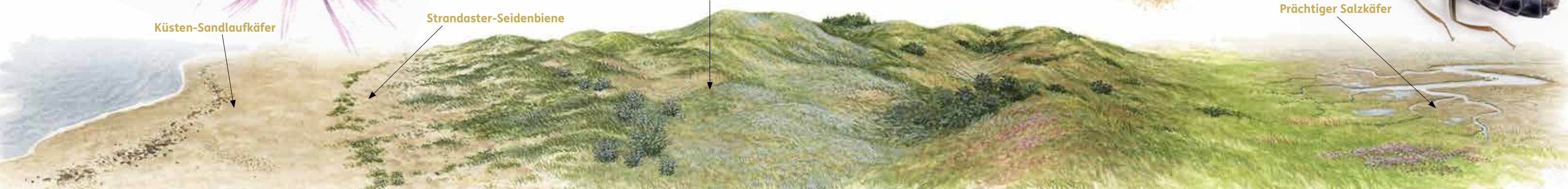
Strand mit Spülsaum