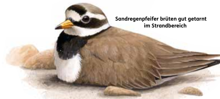
Sandregenpfeifer brüten gut getarnt im Strandbereich