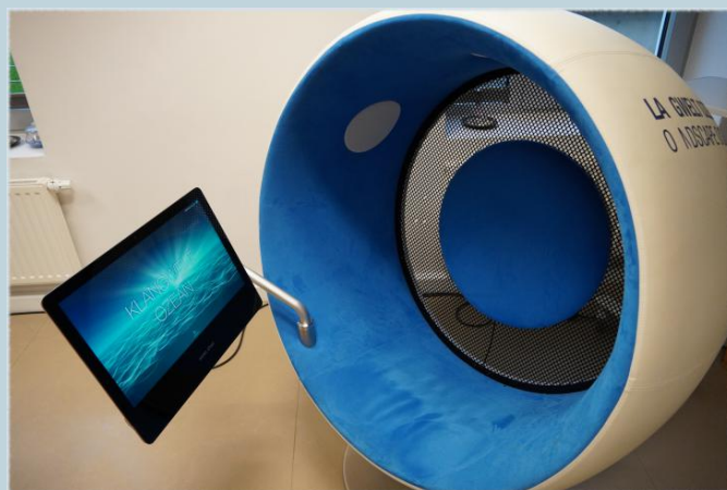
Der Surround-Sessel vom Meeresmuseum

len Brennstoffen suchen oder Rammarbeiten von Windkraftanlagen gestört und überlagert werden. Begleitende Informationen erläutern dabei, wie diese akustische Umweltbelastung die Tiere beeinträchtigt, welche Konsequenzen dies für das fragile Ökosystem der Nordsee hat und wie man den Unterwasserlärm minimieren kann.