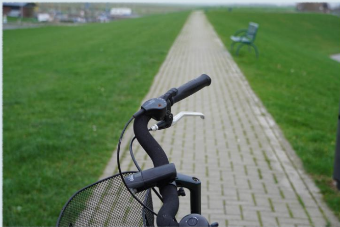
Fahrradweg am Deich

verwaltung in Dorum-Neufeld. Wer aber auf eigene Faust am Wattenmeer entlang radeln möchte, kann dies nun offiziell tun.