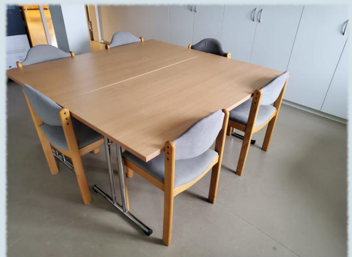
Ein paar der neuen Tische

Mit den neuen Tischen können wir also künftig ein besseres Erlebnis für unsere Gäste und Teilnehmenden bieten und die Vielfalt an Veranstaltungen und Programmen weiter ausbauen. Ein herzliches Dankeschön gilt allen, die dies ermöglicht haben!