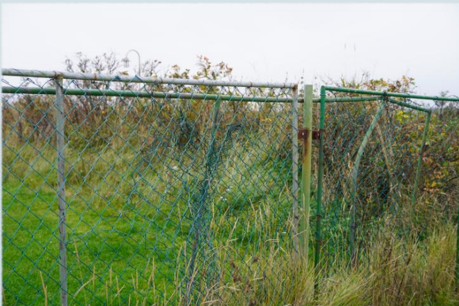
Drahtzaun an der Wurster Küste

In Küstengebieten kann es für Tiere schon mal gefährlich werden sich in der menschengemachten Umgebung zu verletzen. Vor allem Vögel verheddern sich leicht in Netzen oder Zäunen. So leider auch am 30.09.2024 als ein Uhu sich bei Dorum-Neufeld in einem Stacheldrahtzaun bei den Weiden vor dem Deich verfang und dabei verletzte. Eine besorgte Besucherin fand ihn und brachte ihn zu uns ins Nationalpark-Haus.