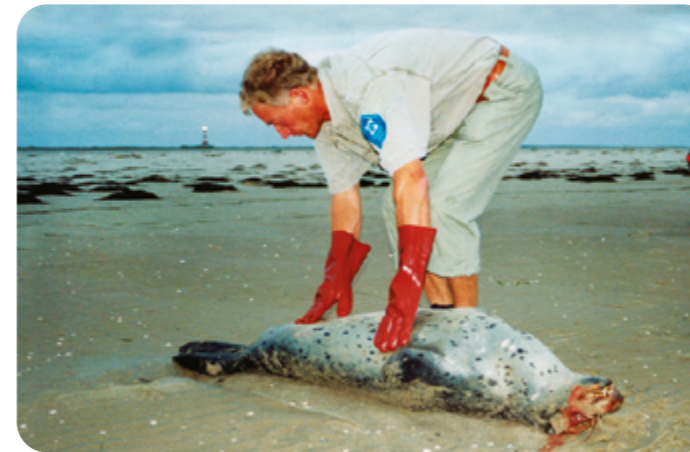
Ein Seehundjäger bei der Bergung eines toten Seehundes.

Auf diese Aufgaben sind die Seehundjäger*innen gut vorbereitet und werden bei verschiedenen Fortbildungen regelmäßig geschult. Sie beherrschen den Umgang mit den Wildtieren und können aufgrund ihrer Erfahrung die richtigen Entscheidungen treffen. Dabei handeln sie nach der „Richtlinie des Landes zur Behandlung von erkrankt, geschwächt oder verlassen aufgefundenen Robben“.