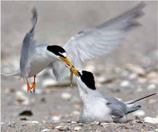
Lütje Steern bröden just op de Stranden.